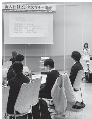
(昨年の研修の様子)

名張商工会議所では、今年も新入社員ビジネスマナー研修を企画しております。この研修は、ビジネスマナー習得により一人前の社会人を育成する講座です。基本となる心構えから接客・応対・マナーまで幅広く、分かり易く研修いたします。詳しくは3月号の会報にてご案内を送付しますので、ご検討をよろしくお願いたします。