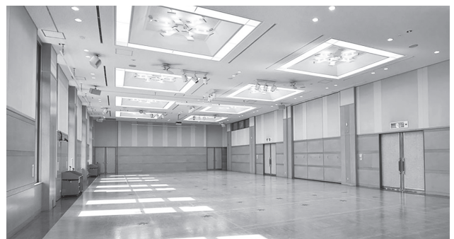
アスピアI(176㎡)+アスピアII(188㎡) 併