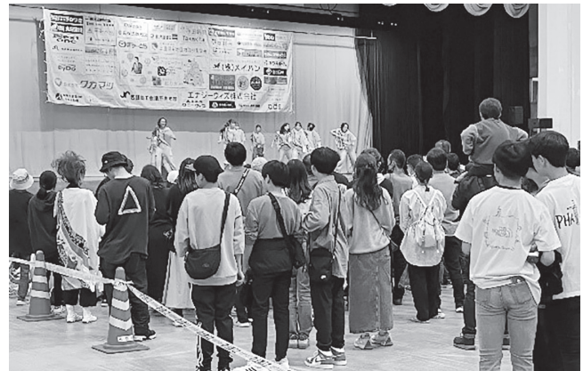
(昨年のステージイベントの様子)