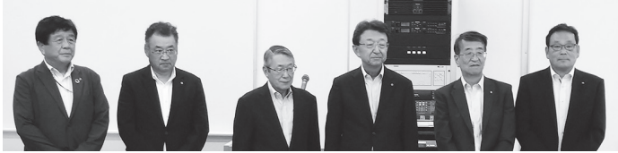
(生命共済部門・目標達成会議所専務理事一同)

会員事業所様の福利厚生に寄与する生命共済制度として、皆様のお役に立てますよう努めて参りますので、引き続きご愛顧のほどよろしくお願い申し上げます。