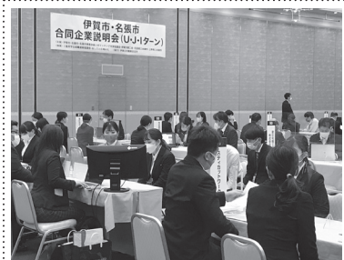
昨年度は県内外から延べ100名の求職者が参加しました

日程：2025年3月4日(火) 時間：第1部 09:30～12:30 第2部 13:30～16:30 会場：上野フレックスホテル (伊賀市平野中川原544-2)